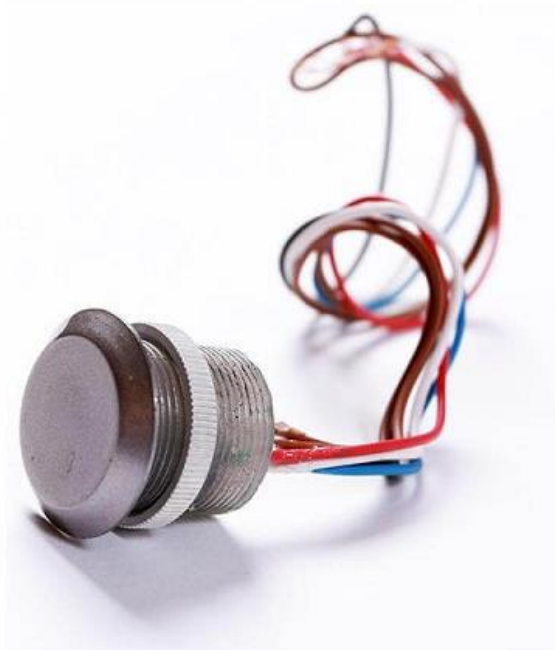
Obrázek č. 2: Pojistná matice.